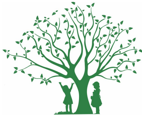
Verein Blätterdach e. V.