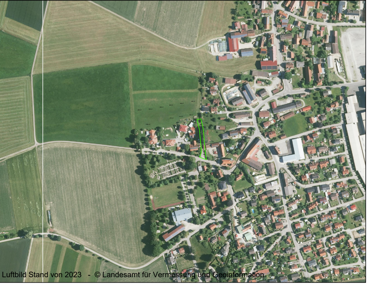
LUFTBILD M 1 : 5.000

Luftbild Stand von 2023